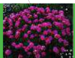
Clavelina de mar